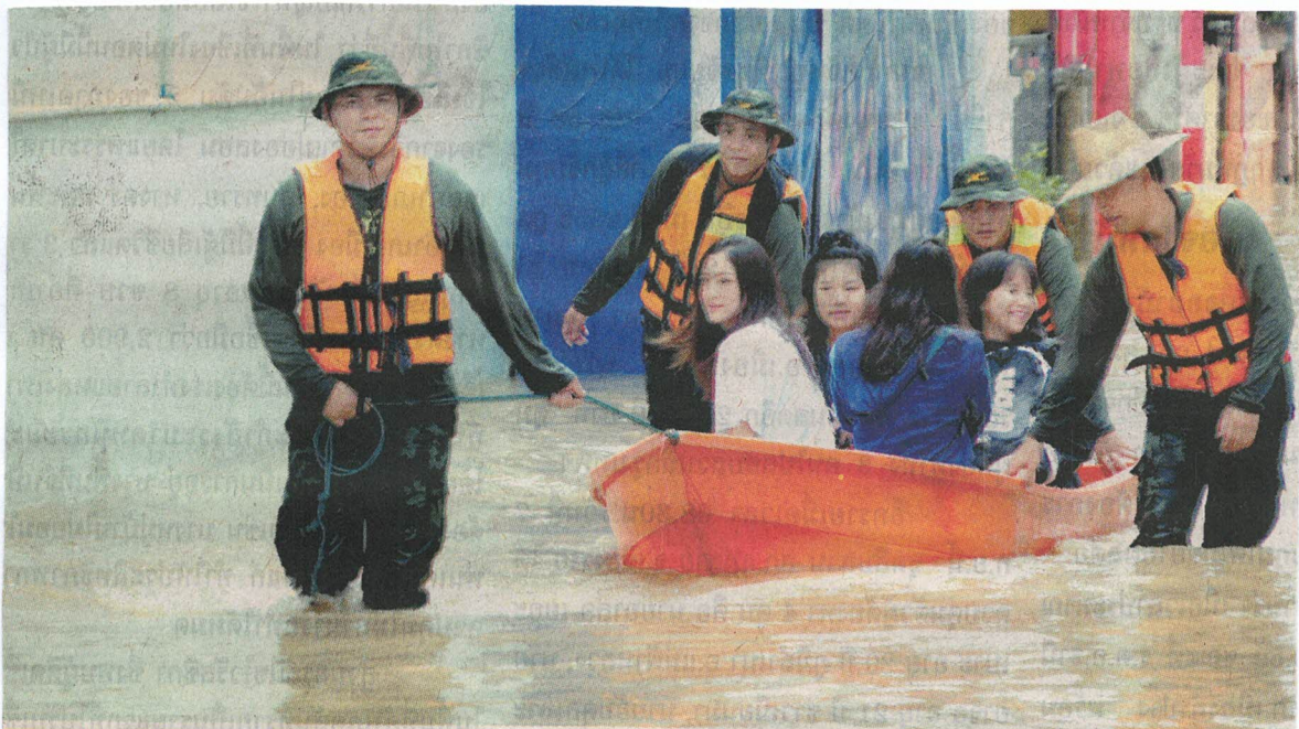
↑ น้ำท่วมรอบ 3...พื้นที่อำเภอแม่ฟ้าหลวง จ.เชียงราย ถูกน้ำท่วมรอบที่ 3 เจ้าหน้าที่ทหารนำเรือท้องแบนช่วยเหลือนอพยพประชาชนและนักเรียนมหาวิทยาลัยแม่ฟ้าหลวงออกจากบริเวณน้ำท่วม เพื่อความปลอดภัย ตามรายละเอียดของข่าวฉบับนี้.

น้ำท่วม ต่อจากหน้า 1 ถนนหน้ามหาวิทยาลัยแม่ฟ้าหลวงติดขัด ส่วนที่ ต.โป่งงามประสบอุทกภัยเช่นกัน ประชาชนหนีน้ำวุ่นวาย ศูนย์เด็กเล็กปิดการเรียนฉับพลัน เหตุการณ์ครั้งนี้ไม่มีผู้เสียชีวิตแต่อย่างใด เนื่องจากเกิดฝนตกหนักในจังหวัด เชียงราย ส่งผลให้น้ำท่วมอย่างฉับพลันหลายพื้นที่ โดยเฉพาะเมื่อเวลา 02.00 น.วันที่ 7 ก.ย.นี้ บริเวณด้านหน้ามหาวิทยาลัยแม่ฟ้าหลวง เกิดน้ำป่าทะลักจากดอยนางแล ดอยปู่ไข และ น้ำที่ล้นแม่น้ำแควต้น ไหลท่วม