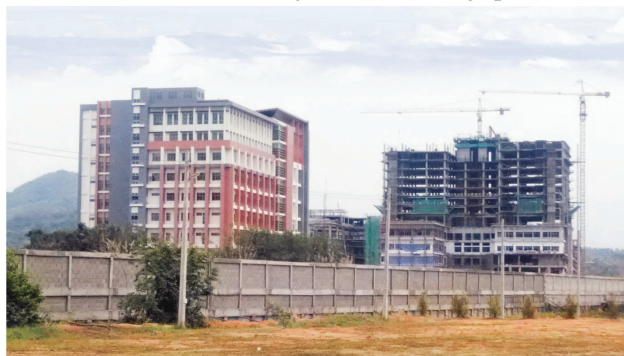
ลงทุน 6,000 ล้าน - มหาวิทยาลัยแม่ฟ้าหลวง จังหวัดเชียงราย ทุ่มงบประมาณกว่า 6,000 ล้านบาท สร้างศูนย์การแพทย์ติดถนนพหลโยธิน ตำบลนางแล โดยกำหนดเปิดบริการปี 2561 ซึ่งจะเป็นที่ศูนย์การแพทย์ สถานศึกษาวิจัย และการรักษาพยาบาลขนาดใหญ่ 400 เตียง และยังมีให้กลุ่มทุนแห่งใหม่ย้ายตัวไปฐานเมืองท่าที่เหนืออีกด้วย

4บ้กโรงพยาบาลเอกชนแห่งล่งทุน-ม.แม่ฟ้าหลวงผุดศูนย์การแพทย์