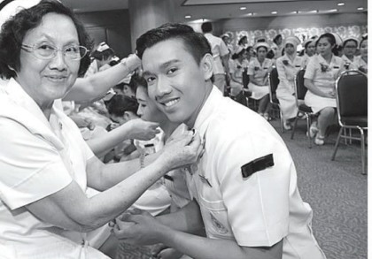
ท.พยาบาลศาสตร์ มหาวิทยาลัยแม่ฟ้าหลวง จัดพิธีประกาศ รายชื่อของนักศึกษาหลักสูตรพยาบาลศาสตรบัณฑิต ประจำปีการ เรียนที่มีผลดีผลหมางพยาบาลและเข็มวิทยฐานะ ให้แก่ผู้สำเร็จการ ปริญญาพยาบาล.