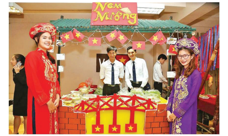
อาเซียนแฟร์ - มหาวิทยาลัยแม่ฟ้าหลวง โดยสำนักวิชาวัฒนธรรมสังคม ร่วมกับส่วนพัฒนานักศึกษา จัดกิจกรรม “ASEAN International Fair 2017” เป็นส่วนหนึ่งของรายวิชาอาเซียนศึกษาให้นักศึกษารู้จักความเป็นอาเซียน และเข้าใจความหลากหลายทางวัฒนธรรมได้อย่างชัดเจน มีกิจกรรมหุ้มมิตร การแสดงบนเวทีที่สะท้อนถึงศิลปวัฒนธรรม วิถีชีวิต และความคิดของคนในชาติอาเซียน รวมทั้งพันธมิตร 6 ประเทศ

สมเด็จพระนางพระตำหนัก เป็นบุญของ สมเด็จพระนางพระตำหนัก มหาวิทยาลัยแม่ฟ้าหลวง ทุกปีที่จะ ไปเชียงราย จะขอเชิญไปให้พระ คองขุน กราบสักการะสมเด็จพระ พระตำหนักคองขุน ข้าพเจ้าขอ สักการะพระราชมารดาสมเด็จพระ มหาวิทยาลัยแม่ฟ้าหลวง เพื่อ มหาวิทยาลัยแม่ฟ้าหลวง เชียงราย จากเดิมมหาวิทยาลัย แห่งใหม่ รัฐบาลยวราชวรพรต คือ รัฐมนตรีใช้จัดตั้งสถาบัน ใน เชียงราย ครั้นแรกจะ ราชบัณฑิตยสถานเป็น แต่ คณะรัฐมนตรีตั้ง ฟ้าหลวง เป็นมหาวิทยาลัย จ.เชียงราย เป็นอนุสรณ์แห่ง ภักดีต่อรัฐบาลและประ อย่างมาจนถึงทุกวันนี้