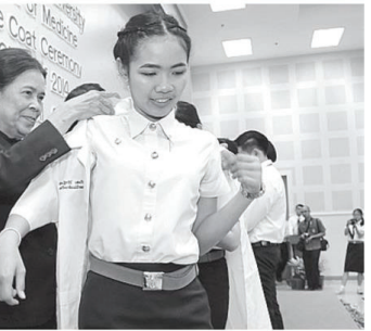
ก.) โดย สำนักวิชาแพทยศาสตร์ จัดพิธีมอบ... ชั้นปีที่ 4 ที่จบการศึกษาระดับวิทยาศาสตร์การ มพล. ก่อนไปศึกษาวิชาแพทย์ระดับชั้นคลินิกที่ ระชากรักษ์ กรุงเทพฯ ต่อไป.