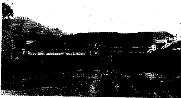
อาคารส่วนหน้าที่สร้างขึ้นเพื่อเป็นสำนักงานอธิการบดีและอาคารเรียนชั่วคราว