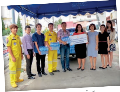
ผู้บริหาร มฟล. มอบน้ำดื่มลานดาว ให้สมาคมศิรกรรมฯ เมื่อวันที่ 8 พ.ค. 57