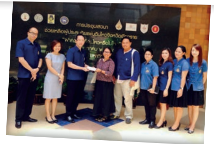
คณะผู้บริหาร มฟล. มอบเงินบริจาค เพื่อช่วยเหลือผู้ประสบภัยแผ่นดินไหว ให้แก่มูลนิธิพัฒนาชุมชนและเขตภูเขา (พชภ.)

จากเหตุการณ์แผ่นดินไหวขนาด 6.3 ริกเตอร์ ความลึก 7 กิโลเมตร ซึ่งมีจุดศูนย์กลางอยู่บริเวณตำบลทรายขาว อำเภอพาน จังหวัดเชียงราย เมื่อวันที่ 5 พ.ค. 2557 เวลา 18.08 น. ส่งผลให้พื้นที่ภาคเหนือรับรู้ถึงแรงสั่นสะเทือนได้ในหลายจังหวัดนั้น ในส่วนของ มฟล. ได้รับแรงสั่นสะเทือนเป็นระยะ เช่นเดียวกับพื้นที่อื่นโดยทั่วไปในเชียงราย รวมถึง อาฟเตอร์ช็อค (After shock) ที่ติดตามมาเป็นระยะ ซึ่งจากการสำรวจอาคารสถานที่ในมหาวิทยาลัยฯ พบว่าไม่ได้รับความเสียหาย นอกจากผนังบางจุดที่มีรอยร้าวบ้างเล็กน้อย และขอยืนยันว่าโครงสร้างและการก่อสร้างมีความมั่นคงแข็งแรงเนื่องจากได้ออกแบบเพื่อรองรับอุบัติเหตุ และแผ่นดินไหวมาเป็นอย่างดี และได้มีการจัดทำคู่มือการรับมือแผ่นดินไหวแจกจ่ายให้แก่นักศึกษา เจ้าหน้าที่ และบุคคลทั่วไป เพื่อให้ทุกคนได้เรียนรู้ถึงวิธีปฏิบัติเมื่อเกิดแผ่นดินไหว จัดซ้อมเหตุไฟไหม้ แผ่นดินไหว ให้แก่นักศึกษาเป็นประจำ นอกจากนี้ภายในหอพักนักศึกษามีระบบเสียงตามสายที่จะกระจายข่าวสารให้แก่นักศึกษาได้อย่างทั่วถึง