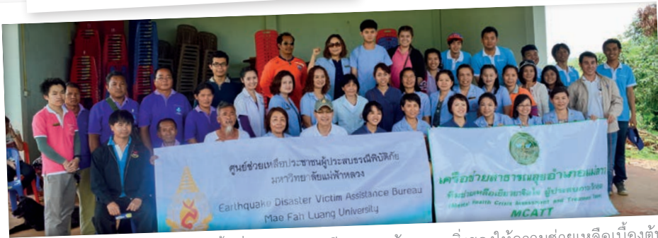
กลุ่มนักศึกษาของพื้นที่สำรวจความเสียหาย พร้อมมอบสิ่งของให้ความช่วยเหลือเบื้องต้น