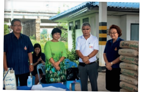
ผู้บริหาร มฟล. พร้อมกลุ่มกสิบลำดวนมอบสิ่งก่อสร้าง