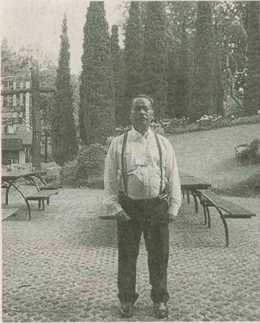
เมื่อครั้งทำงานอยู่โรงแรมโอเรียนเต็ล เป็นผู้จัดการฝ่ายจัดเลี้ยงต้อนรับอดีตนายกรัฐมนตรีไทย