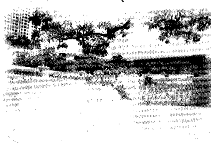
ป้อมป้องกันจามิตร

เรียกว่า คนที่มาเที่ยววัดนี้จะได้เห็นถึงความสวย งามหลากหลายของศิลปะแบบต่างๆ รวมทั้ง พระพุทธรูป และของดีคู่วัดอีกหลายสิ่ง