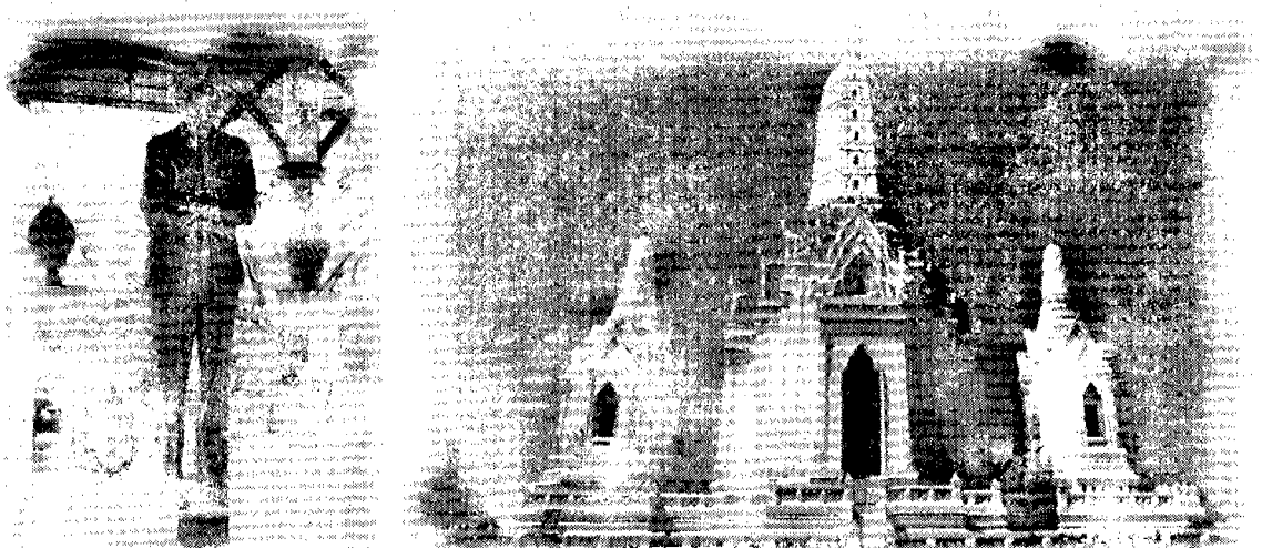
อุทยานเฉลิมพระเกียรติ สมเด็จพระศรีนครินทราบรมราชชนนี

องค์ใหญ่เป็นที่ประดิษฐานพระพุทธรูปเจ้า 4 องค์หัน พระพักตร์ไปสี่ทิศ ขณะพระปรางค์องค์เล็ก 2 องค์เป็นที่