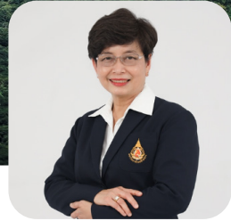
รศ.ดร.ชยาพร วัฒนศิริ