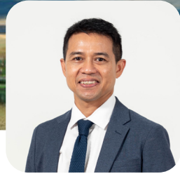
รศ.ดร.ณัฐพงศ์ จิตรนิรัตน์