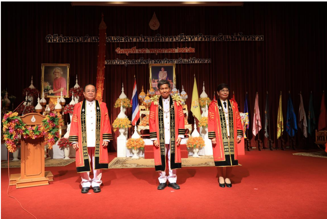
พิธีส่งมอบตำแหน่งและสถาปนาอธิการบดีมหาวิทยาลัยแม่ฟ้าหลวง เมื่อวันที่ 15 พฤษภาคม 2562 ณ หอประชุมสมเด็จย่า มหาวิทยาลัยแม่ฟ้าหลวง จังหวัดเชียงราย