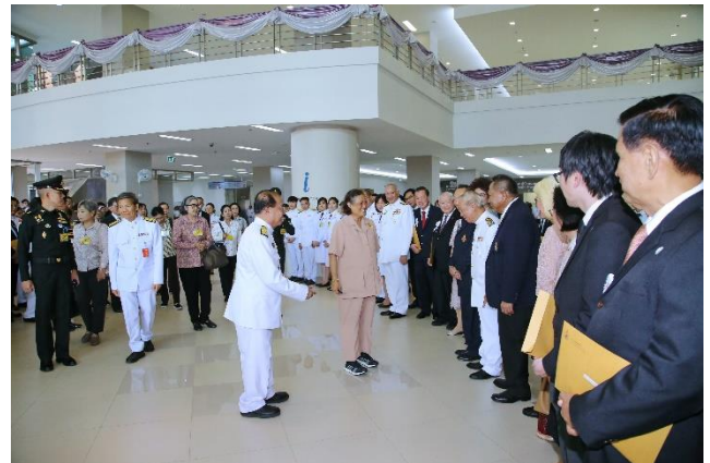
พิธีเปิดโรงพยาบาลศูนย์การแพทย์มหาวิทยาลัยแม่ฟ้าหลวง เมื่อวันที่ 12 กุมภาพันธ์ 2562 ณ ศูนย์การแพทย์มหาวิทยาลัยแม่ฟ้าหลวง จังหวัดเชียงราย