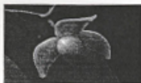
ดอกไม้ประจำมหาวิทยาลัย คือ ดอกหอมนวล (ถ้าหวาน)