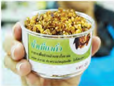
น้ำพริกน้ำเมียงคั่ว

“เครื่องปรุงรสล้านนา อุดมไปด้วยสารต้านอนุมูลอิสระจากชา”