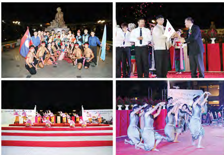
▲ งานสานสัมพันธ์ไทย-ลาว

สังคม โดยเฉพาะด้านการศึกษา และความร่วมมือทางวิชาการ ซึ่งมหาวิทยาลัยแม่ฟ้าหลวง (มฟล.) เป็นหนึ่งในสถาบันการศึกษาทางภาคเหนือของไทย และอยู่ใกล้ชิดกับแนวทางเหนือของ สปป.ลาว มีความตระหนักถึงการส่งเสริมความร่วมมือทางวิชาการและบุคลากรระหว่างกันอย่างต่อเนื่อง ปัจจุบัน มฟล. มีนักศึกษาต่างชาติจำนวนกว่า 400 คน ส่วนมากเป็นนักศึกษาจากประเทศเพื่อนบ้าน อย่างเช่น สปป.ลาว มีนักศึกษาที่กำลังศึกษาอยู่ทั้งหมด 22 คน เป็นระดับปริญญาเอก 1 คน ระดับปริญญาโท 17 คน และระดับปริญญาตรี 4 คน