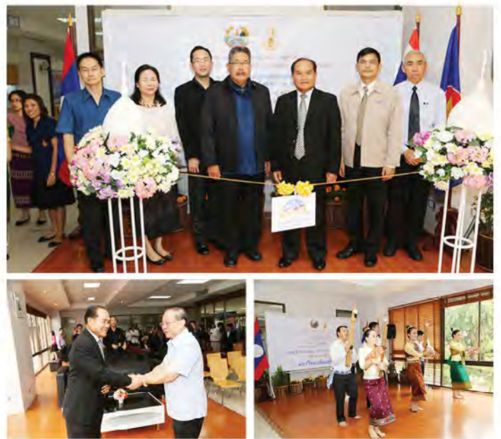
▲ งานวันชาติลาว

เมื่อวันที่ 7-9 ธันวาคม 2556 ที่ผ่านมา ทาง มฟล. ได้เป็นเจ้าภาพในการจัดกิจกรรมงานสานสัมพันธ์ ไทย-ลาว ครั้งที่ 11 โดยมี 11 สถาบันเข้าร่วมโครงการ ซึ่งเป็นกิจกรรมหนึ่งที่มีประวัติศาสตร์ยาวนาน โดยมุ่งหวังให้นักศึกษาได้มีส่วนร่วมในการอนุรักษ์ และเผยแพร่ศิลปวัฒนธรรมไทย ในแต่ละภูมิภาค และประเทศเพื่อนบ้าน เพื่อแลกเปลี่ยนประสบการณ์ในด้านศิลปวัฒนธรรม ซึ่งกันและกัน ที่ได้รับการสืบทอดจากรุ่นสู่รุ่น และจะต้องช่วยกันดูแลและรักษาสืบไป