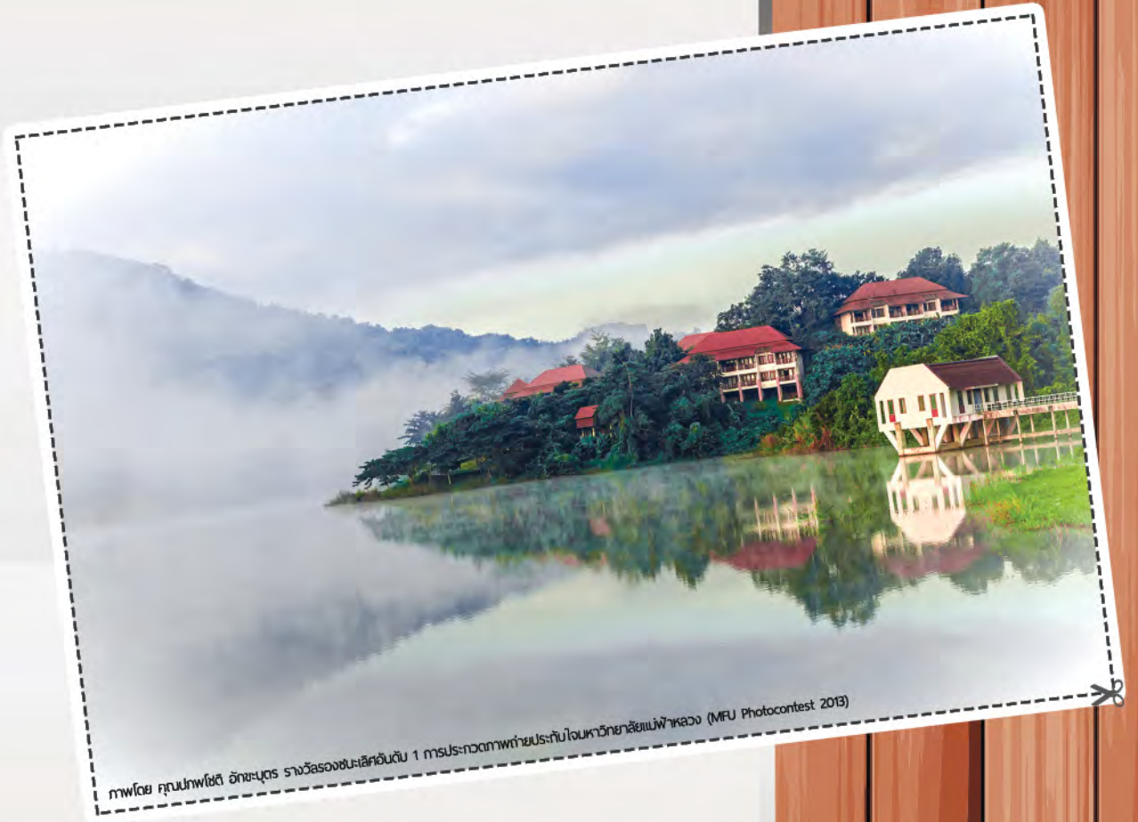
รางวัลรองชนะเลิศอันดับ 1 การประกวดภาพถ่ายประจําใจมหาวิทยาลัยแม่ฟ้าหลวง (MFU Photocontest 2013)

โชคดีแค่ไหน ที่ใครหลายคนได้มองเห็นความงดงามซ่อนตัวอยู่ในสถานที่ธรรมดาๆ ซึ่งเป็นความงดงาม ที่คนอื่นมองไม่เห็น