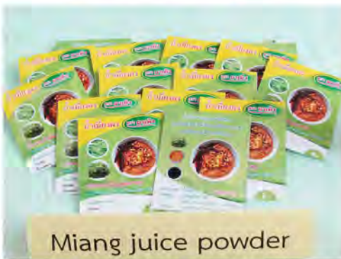
น้ำเมียงผง