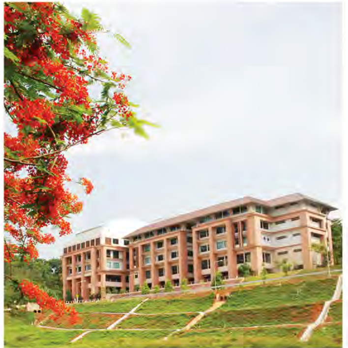
▲ อาคารปริคลินิก (M3) สถานที่ตั้งสำนักวิชาทันตแพทยศาสตร์

เรากำหนดในหลักสูตรไว้ว่า ก่อนจบการศึกษานักศึกษา จะต้องได้รับการฝึกอบรมเกี่ยวกับประเทศเพื่อนบ้าน โดย มฟล. ได้ทำความร่วมมือทางวิชาการกับประเทศเพื่อนบ้านโดยรอบ ซึ่ง เราตกลงแลกเปลี่ยนด้านวิชาการกันในหลายรูปแบบ ทั้งแลกเปลี่ยน อาจารย์และนักศึกษารวมถึงนักวิจัย ก็เป็นช่องทางที่นักศึกษา จากประเทศเพื่อนบ้านจะเข้ามาเรียนรู้กับเรา และนักศึกษาจาก เราจะได้ไปเรียนรู้วัฒนธรรมอื่นในต่างประเทศด้วย นอกจากนี้