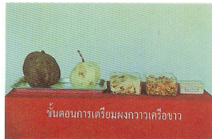
ขั้นตอนการเตรียมผงกวาวเครือขาว