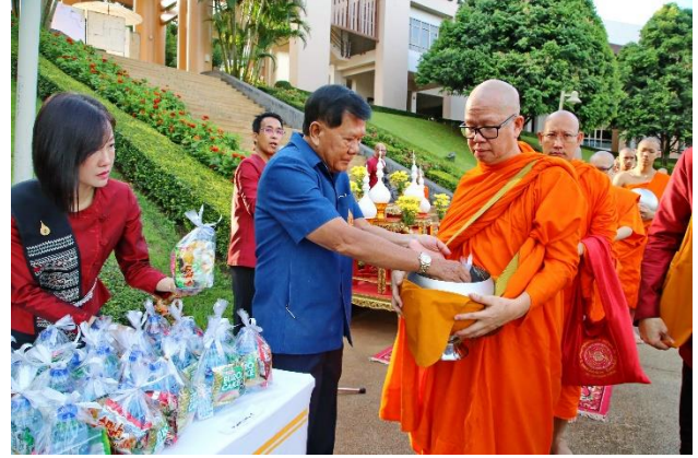
พิธีทำบุญตักบาตร เนื่องในโอกาสครบรอบ 20 ปี แห่งการสถาปนามหาวิทยาลัยแม่ฟ้าหลวง เมื่อวันที่ 24 กันยายน 2561 ณ มหาวิทยาลัยแม่ฟ้าหลวง จังหวัดเชียงราย