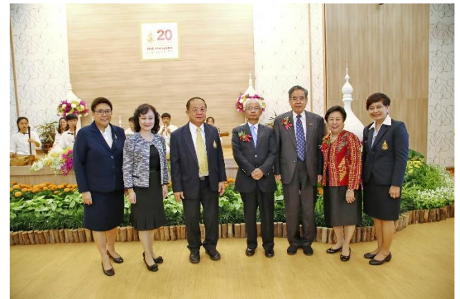
กิจกรรมเนื่องในโอกาสครบรอบ 20 ปี แห่งการสถาปนามหาวิทยาลัยแม่ฟ้าหลวง เมื่อวันที่ 25 กันยายน 2561 ณ มหาวิทยาลัยแม่ฟ้าหลวง จังหวัดเชียงราย