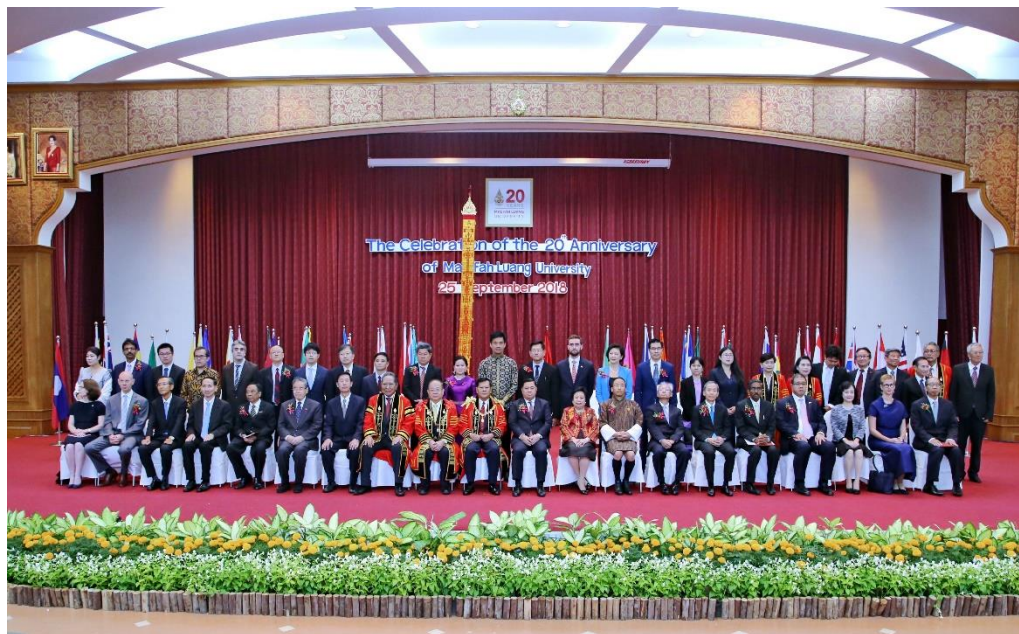
กิจกรรมเนื่องในโอกาสครบรอบ 20 ปี แห่งการสถาปนามหาวิทยาลัยแม่ฟ้าหลวง เมื่อวันที่ 25 กันยายน 2561 ณ มหาวิทยาลัยแม่ฟ้าหลวง จังหวัดเชียงราย