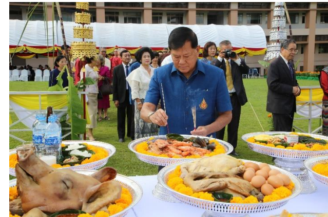
พิธีบวงสรวงบูรพกษัตริย์ เนื่องในโอกาสครบรอบ 20 ปี แห่งการสถาปนามหาวิทยาลัยแม่ฟ้าหลวง เมื่อวันที่ 24 กันยายน 2561 ณ ลานเฉลิมพระเกียรติฯ มหาวิทยาลัยแม่ฟ้าหลวง จังหวัดเชียงราย