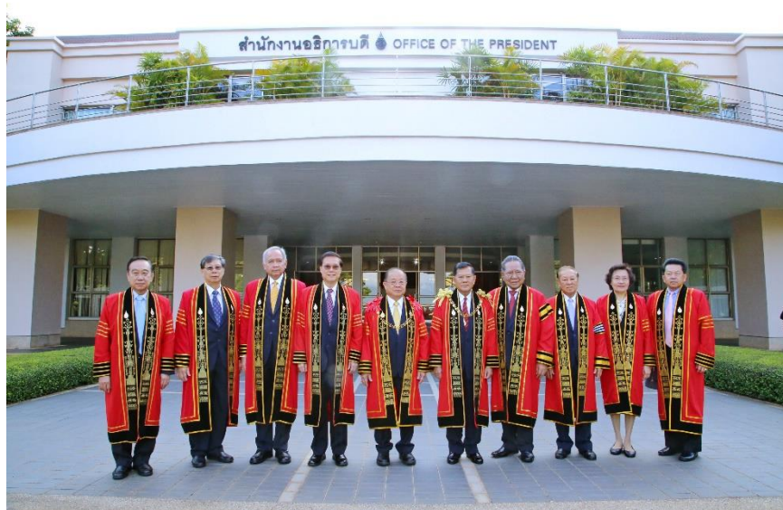
พิธีถวายสักการะพระราชนุสาวรีย์สมเด็จพระศรีนครินทราบรมราชชนนี เนื่องในโอกาสครบรอบ 20 ปี แห่งการสถาปนามหาวิทยาลัยแม่ฟ้าหลวง เมื่อวันที่ 25 กันยายน 2561 ณ มหาวิทยาลัยแม่ฟ้าหลวง จังหวัดเชียงราย