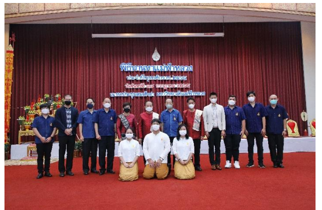
พิธีทานหาแม่ฟ้าหลวง ประจำปีพุทธศักราช 2565 เมื่อวันที่ 18 กรกฎาคม 2565 ณ มหาวิทยาลัยแม่ฟ้าหลวง จังหวัดเชียงราย