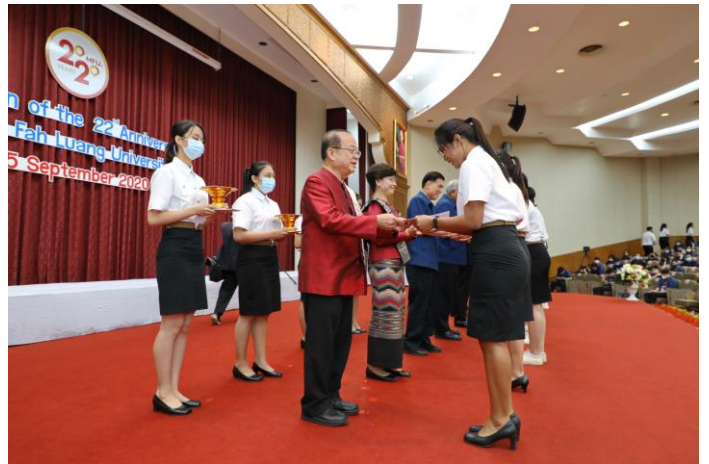
กิจกรรมเนื่องในโอกาสครบรอบ 22 ปี แห่งการสถาปนามหาวิทยาลัยแม่ฟ้าหลวง เมื่อวันที่ 25 กันยายน 2563 ณ มหาวิทยาลัยแม่ฟ้าหลวง จังหวัดเชียงราย