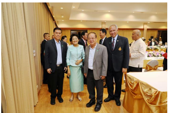
งานเลี้ยงรับรองเนื่องในโอกาสครบรอบ 22 ปี แห่งการสถาปนามหาวิทยาลัยแม่ฟ้าหลวง เมื่อวันที่ 24 กันยายน 2563 ณ วนาศรมรีสอร์ท มหาวิทยาลัยแม่ฟ้าหลวง จังหวัดเชียงราย