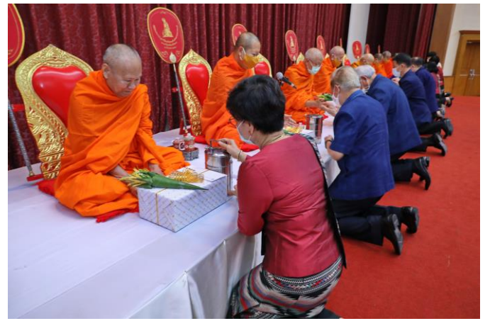
พิธีทานหาแม่ฟ้าหลวง ประจำปีการศึกษา 2563 เมื่อวันที่ 17 กรกฎาคม 2563 ณ มหาวิทยาลัยแม่ฟ้าหลวง จังหวัดเชียงราย