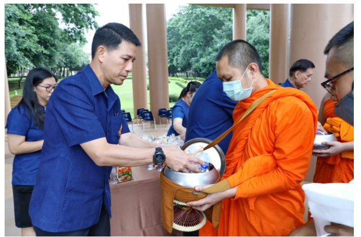
กิจกรรมเนื่องในโอกาสครบรอบ 22 ปี แห่งการสถาปนามหาวิทยาลัยแม่ฟ้าหลวง เมื่อวันที่ 25 กันยายน 2563 ณ มหาวิทยาลัยแม่ฟ้าหลวง จังหวัดเชียงราย