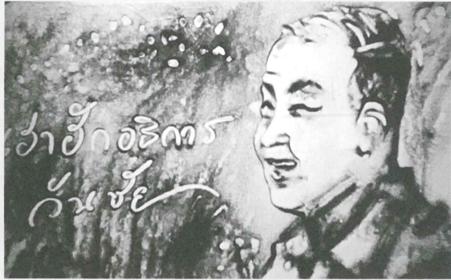
ภาพวาดทรายประกอบกรอกล่าวเชิดชูคุณูปการของ ดร.ชยาพร ต่อ ดร.วันชัย โดยอาจารย์ก้องเกียรติ กองจันทร์ดี

26 เมษายน 2562 เป็นอีกวันที่จะอยู่ในความทรงจำของ "ชาวมหาวิทยาลัยแม่ฟ้าหลวง" เช่นเดียวกับวันที่ 26 มีนาคม 2541 วันเปิดกรุยทางจากถนนพหลโยธินเข้าสู่ "ดอยแม่ม" ของชาวเชียงใหม่ที่ตรงกับวันเกิดจุฬาลงกรณ์มหาวิทยาลัยปีที่ 82 อย่างน่าอัศจรรย์