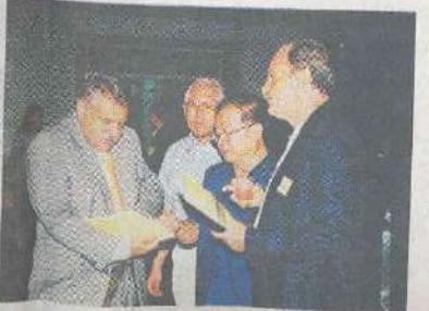
บุคลากรฝ่ายเป็นเกียรติของมหาวิทยาลัยแม่ฟ้าหลวง

สำหรับการนำพามหาวิทยาลัยสู่ความเป็นสากล อธิการบดีมฟล. ให้คำมั่นว่า มฟล. ยังคงเดินหน้าเปิดประตูเชื่อมสัมพันธ์ไมตรีกับนานาชาติในความ ร่วมมือทางวิชาการ และการเปิดรับนักศึกษานานาชาติ มากยิ่งขึ้น เพื่อการแลกเปลี่ยนความรู้ ประสบการณ์ และการเรียนรู้ซึ่งกันและกัน และที่สำคัญคือการนำ การศึกษาเป็นจุดเชื่อมของสันติภาพในโลก