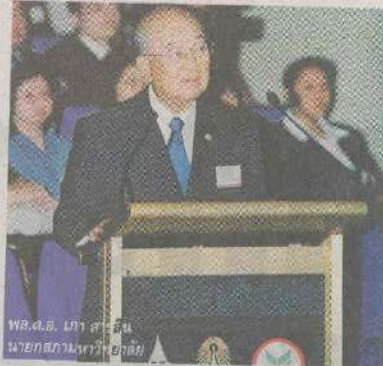
พล.อ. อาภา สารสิน นายกรัฐมนตรี

ปัจจุบันมหาวิทยาลัยแม่ฟ้าหลวงได้แบ่งการบริหารงานวิชาการเป็น 8 สำนักวิชา โดยเปิดสอนระดับอนุปริญญา 1 หลักสูตร ปริญญาตรี 22 หลักสูตร ปริญญาโท 15 หลักสูตร และปริญญาเอก 5 หลักสูตร มีนักศึกษาทั้งหมดระดับปริญญาตรี ปริญญาโท จนถึงปริญญาเอกจำนวนทั้งสิ้น 6,430 คน ในขณะที่ได้ผลิตบัณฑิตออกไปสู่สังคมในช่วงปี 2545-2548 ในระดับ