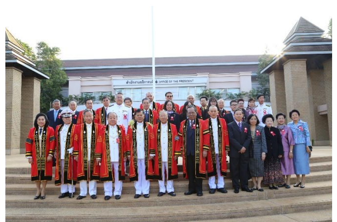
พิธีพระราชทานปริญญาบัตรแก่ผู้สำเร็จการศึกษา ประจำปีการศึกษา 2557 เมื่อวันที่ 9 กุมภาพันธ์ 2559