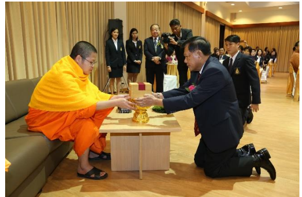
งานเลี้ยงรับรองเพื่อเป็นเกียรติแก่ผู้ได้รับพระราชทานปริญญา ดุษฎีบัณฑิตกิตติมศักดิ์ ปีการศึกษา 2557 และรางวัลเชิดชูเกียรติ “ตุงทองคำ” เมื่อวันที่ 8 กุมภาพันธ์ 2559