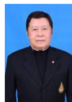
พลตำรวจเอก ดร.ประสาน วงศ์ใหญ่