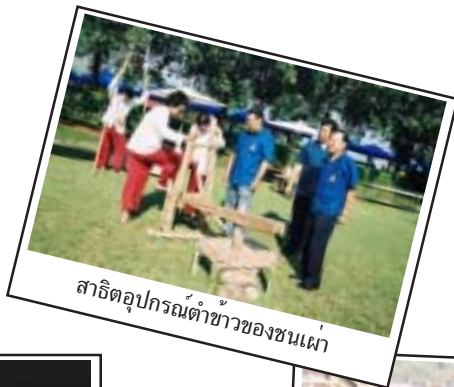
สาธิตอุปกรณ์ดำข้าวของชนเผ่า