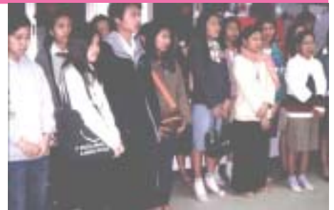
บางส่วนของผู้เข้าร่วมงาน