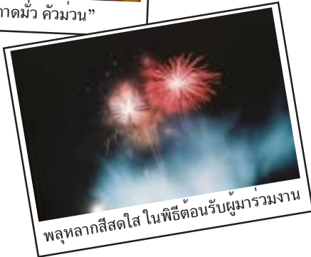
พลุหลากสีสดใส ในพิธีต้อนรับผู้มาร่วมงาน