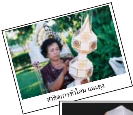
สาธิตการทำโคม และตุง