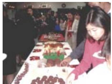
รับประทานอาหารฝรั่งเศสอย่างเป็นกันเอง