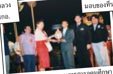
รองเลขาธิการคณะกรรมการการอุดมศึกษา มอบตราสัญลักษณ์ให้แก่ผู้แทน จากมหาวิทยาลัยศรีปทุม เจ้าภาพครั้งต่อไป