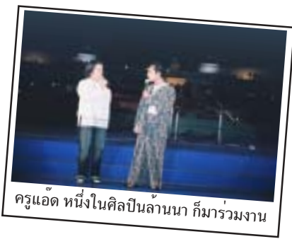
ครูแอด หนึ่งในศิลปินล้านนา ก็มาร่วมงาน