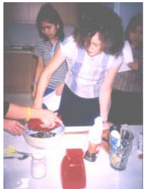
อึดมอริ่อยกับกิจกรรมการทำขนมฝรั่งเศส