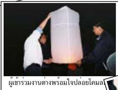
ผู้เข้าร่วมงานต่างพร้อมใจไปลอยโคมล