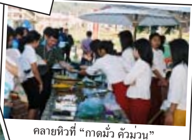
คลายหิวที่ “กาดมั่ว คั่วม่วน”