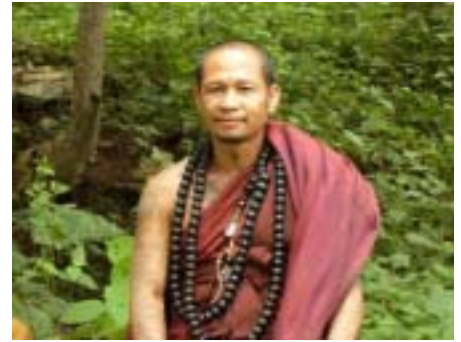
ตนบุญ- แห่งขุนเขา พระครูบาเหนือชัย

การเดินทางไปยังถ้ำป่าอาชาทองแห่งนี้ ใช้เส้นทางเชียงราย-แม่จัน-แม่สาย โดยทางแยกเข้าถ้ำป่าอาชาทองห่างจากตัวอำเภอแม่จันเพียง 7 กิโลเมตร มีป้ายบอกทางไปตลอดเส้นทาง และจากทางแยกถนน หมู่บ้านแม่คำหลักเจ็ด ไปยังถ้ำป่าอาชาทองใช้ระยะทางอีกประมาณ 6 กิโลเมตร ก็จะถึงยังจุดหมาย ประการสำคัญรถที่จะใช้เดินทางเข้าไบนั้น ต้องเป็นรถที่ขับเคลื่อนได้คล่องตัวทั้งนี้เพราะถนนที่จะเดินทางเข้าไบนั้นเป็นลักษณะขึ้นเขาสูงชัน และเป็นดินลูกรัง แต่หากท่านใดไม่ชินกับเส้นทางและขับรถไม่คล่อง ณ หมู่บ้านแม่คำหลักเจ็ดก็จะมีรถตู้ไว้คอยบริการรับและส่งท่านไปส่งยังจุดหมายอีกด้วย 🚗