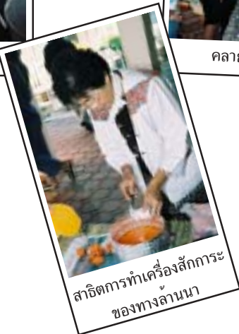
สาธิตการทำเครื่องสักการะ ของทางล้านนา