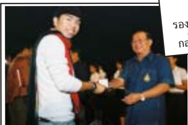
อธิการบดี และผู้บริหาร มหาวิทยาลัยแม่ฟ้าหลวง มอบของที่ระลึกแก่ผู้แทนทุกสถาบันที่เข้าร่วม