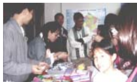
จับสลากแลกของขวัญกันอย่างครื้นเครง

ผู้เข้าร่วมโครงการนี้ได้รับประโยชน์หลายด้าน ไม่ว่าจะเป็นการฝึกพูดสนทนาภาษาฝรั่งเศสแบบง่ายๆ แล้วยังได้เรียนรู้วัฒนธรรมตะวันตก เช่น การปรุงอาหาร การร้องเพลง ศิลปะการตกแต่ง ยิ่งกว่านั้นการจัดงานครั้งนี้ยังถือเป็นการประชาสัมพันธ์หน่วยความร่วมมือทางวิชาการฝรั่งเศสฯ ซึ่งเป็นหน่วยงานใหม่ให้เป็นที่รู้จักแก่สาธารณชนมากยิ่งขึ้น และยังเป็นเปิดโอกาสให้บุคคลภายนอกได้เข้ามารู้จักมหาวิทยาลัยแม่ฟ้าหลวงดียิ่งขึ้นไปอีก