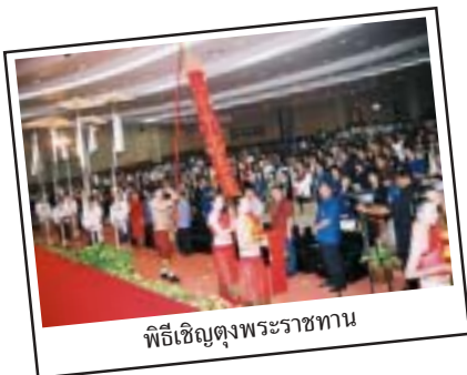
พิธีเชิญตุงพระราชทาน