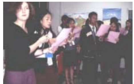
สนุกสนานกับการร้องเพลงคริสต์มาสร่วมกัน