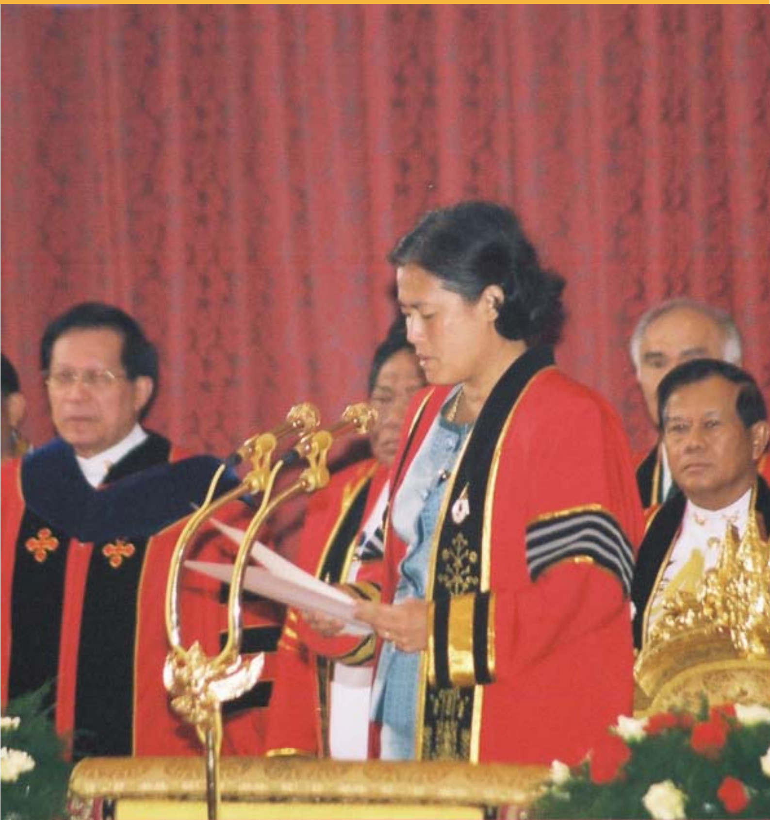
สมเด็จพระเทพรัตนราชสุดาฯ สยามบรมราชกุมารี เสด็จพระราชดำเนินแทนพระองค์ ในการพระราชทานปริญญาบัตร แก่บัณฑิต มหาวิทยาลัยแม่ฟ้าหลวง ครั้งที่ 3