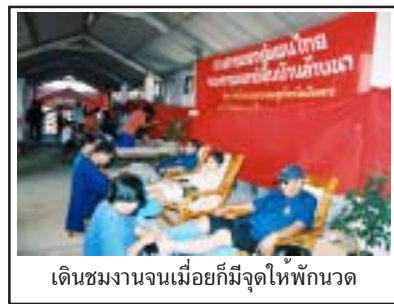
เดินชมงานจนเมื่อยก็มีจุดให้พักนวด