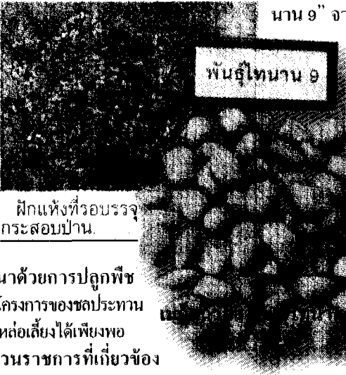
ฝักแห้งที่รอบรรจุกระสอบป่าน

ได้แก่ โครงการชลประทานห้วยหลวง สำนักงานเกษตรจังหวัดอุดรธานี อำเภอภูผามาศ ร่วมกันวางแผนปลูกพืชในฤดูแล้ง โดย ให้ไปรับเมล็ดพันธุ์ "ถั่วลิสงไทนาน 9" จากเขื่อนน้ำอูน จังหวัด