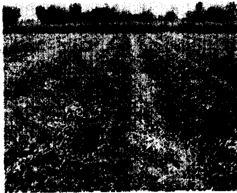
ช่วงที่เก็บเกี่ยวในเดือนเมษายนปีนี้.

อุดรธานี บอกว่า...ถั่วลิสง จึงเป็นกิจกรรมหนึ่งที่ “โครงการพัฒนาอาชีพเกษตรกร” ในเขตพื้นที่โครงการสงน้ำและบำรุงรักษาห้วยหลวง จังหวัดอุดรธานี ภายใต้งบเงินกู้เพื่อปรับโครงสร้างภาคเกษตร (ASPL-Agriculture Sector Program Loan)