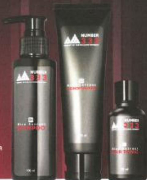
1 RICE EXTRACT SHAMPOO 2 RICE EXTRACT CONDITIONER 3 RICE EXTRACT HAIR TONIC

วิธีใช้ ฉีดแฮร์โทนิกบริเวณหนังศีรษะ ที่แห้งหรือหมัก คลึงเบาๆ ทิ้งไว้ให้แห้ง โดยไม่ต้องล้างออก