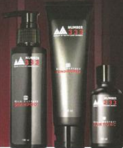
1 RICE EXTRACT SHAMPOO 2 RICE EXTRACT CONDITIONER 3 RICE EXTRACT HAIR TONIC

After use Rice Extract Shampoo & Conditioner, spray Rice Extract Hair Tonic onto dry scalp. Massage scalp gently. Leave to dry without rinsing.