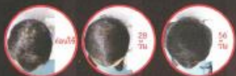
ภาพผู้ทดลองใช้ผลิตภัณฑ์ป้องกันผมร่วง นัมเบอร์ 333