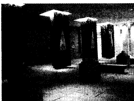
ห้องศึกษาคำนี้

ต่อด้วย “ศึกษาผีนั้น” ที่อังกฤษทำสงครามกับจีนเนื่อง