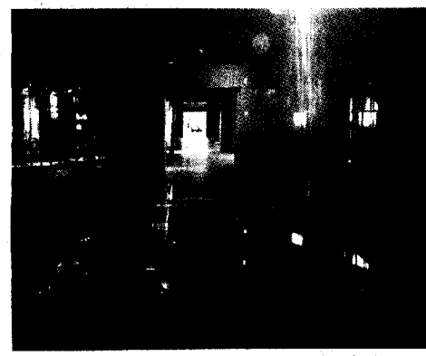
หนึ่งในบริเวณที่เป็นส่วนจัดแสดง

รูปแบบการจัดแสดง นำเอาเทคนิคแสง สี และเสียง มาประกอบช่วยทำให้ผู้ชมเพลิดเพลินไปกับสาระความรู้เรื่องผีนั้นในเชิง “เอ็นเตอร์เทนเมนต์”