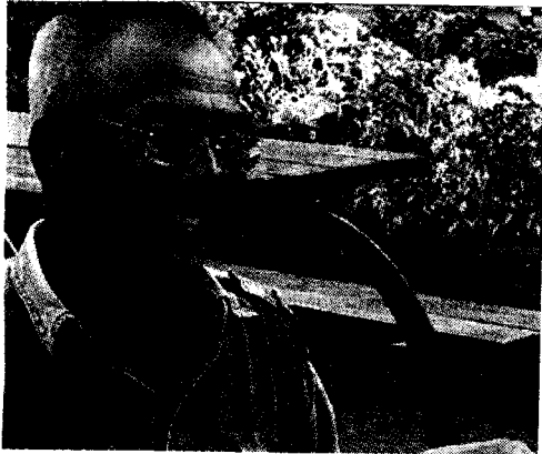
ม.ร.ว.ดิศนัดดา ดิศกุล

จากพระราชปรารภดังกล่าว มูลนิธิแม่ฟ้าหลวง ในพระบรมราชูปถัมภ์ และการท่องเที่ยวแห่งประเทศไทย (ททท.) จึงดำเนินการจัดสร้าง หอฝิ่น อุทยานสามเหลี่ยมทองคำ ชั้นที่ บ้านสบรวก ต.เวียง อ.เชียงแสน จ.เชียงราย