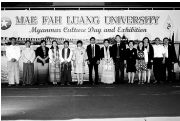
จากเมียนมาร์ - ส่วนงานสัมพันธ์ระหว่างประเทศ มหาวิทยาลัยแม่ฟ้าหลวง ร่วม กับนักศึกษานานาชาติจากเมียนมาร์ ติงงาน เมียนมาร์ วัฒนธรรม คติ 2014 แสดงศิลปวัฒนธรรมประจำชาติ โดยมีผู้แทนสถานเอกอัครราชทูตเมียนมาร์ประจำ ประเทศไทย ร่วมงาน