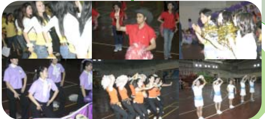
Cheer Leader ของแต่ละสีต่างวาดลวดลาย โยกย้าย สายสะโพก