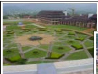
วันที่ 14 ตุลาคม 2546