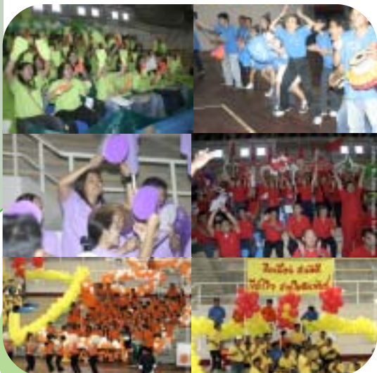
สีส้มของบรรณาดอกเชียง