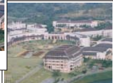
วันที่ 13 ตุลาคม 2548