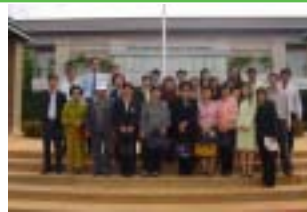
คณะครุศาสตร์ ม.ราชภัฏสวนดุสิต

โดยในการนี้ได้มีการปรึกษาหารือเกี่ยวกับความร่วมมือทางการแลกเปลี่ยนและการศึกษาระหว่างกันในอนาคตอีกด้วย