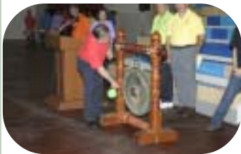
เปิดงานโดยอธิการบดีม.แม่ฟ้าหลวง

เมื่อวันที่ 14 ตุลาคมที่ผ่านมา ส่วนการเจ้าหน้าที่ มหาวิทยาลัยแม่ฟ้าหลวง ได้จัดงานกีฬานักงานสัมพันธ์ขึ้น ทั้งนี้ เพื่อสร้างความสมัครสมานสามัคคี อีกทั้งยังสร้างความร่วมมือ ร่วมใจ และเป็นการกระชับความสัมพันธ์อันดีระหว่างผู้บริหาร และพนักงานอีกด้วย ซึ่งบรรยากาศในการแข่งขันเป็นไปอย่างสนุกสนาน เนื่องจากผู้บริหารต่างพร้อมใจกันลงสนาม เรียกขวัญและกำลังใจให้แก่ลูกสีได้เป็นอย่างดี ทำให้การจัดงานในครั้งนี้บรรลุวัตถุประสงค์ได้อย่างแท้จริง