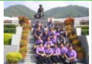
คณะศึกษาศาสตร์ ม.เกษตรศาสตร์