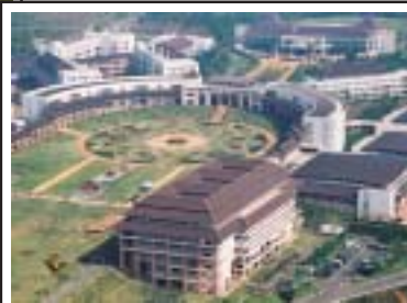
วันที่ 16 ธันวาคม 2547