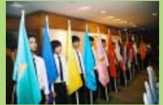
ขบวนเกียรติยศอันเชิญพระบรมราชโองการ และตุ๊กพระราชทาน