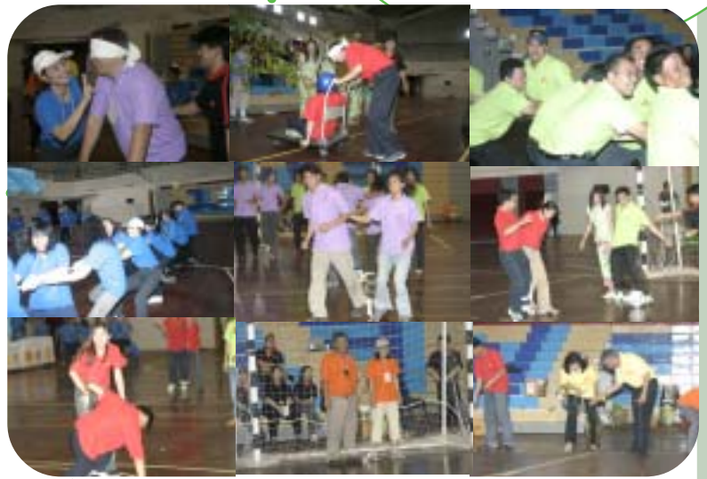
ผู้บริหาร อาจารย์ และพนักงาน ร่วมลงแข่งขันกันอย่างสนุกสนาน