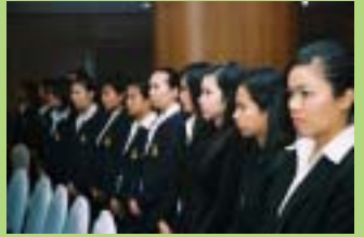
ผู้บริหาร คณาจารย์ พนักงาน และนักศึกษา พร้อมแขกผู้มีเกียรติร่วมเป็นสักขีพยานในพิธี