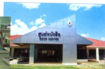
ห้องสมุด