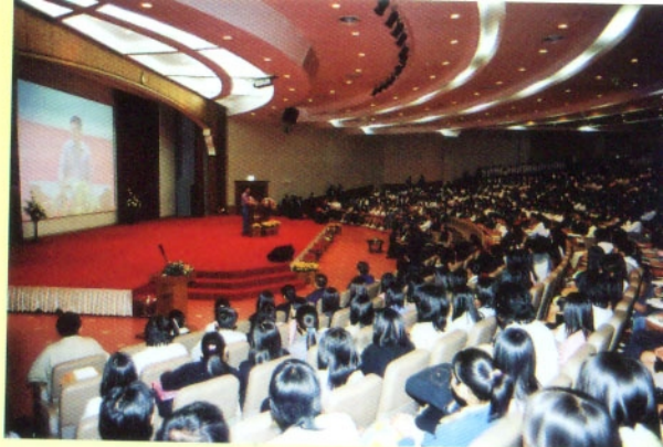
ห้องประชุม