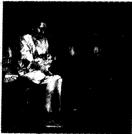
▲ พระราชทานของที่ระลึกให้กับผู้ที่สนับสนุนโครงการ