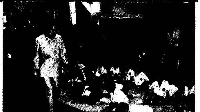
▲ เด็ก ๆ จากศูนย์เด็กก่อนวัยเรียน พีระยา- นาวิน ในความดูแลของพีระยานุเคราะห์มูลนิธิ ฝ่าย รับเสด็จ