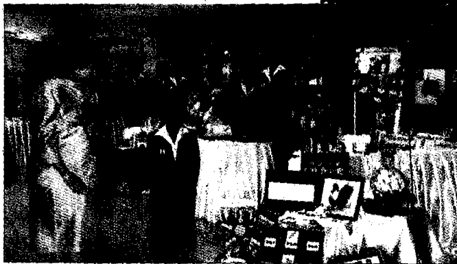
▲ เสด็จ ทอดพระเนตรนิทรรศการการเรียนการสอน การผลิตสื่อการเรียนการสอนของมูลนิธิ

ของขวัญปีใหม่เพื่อคุณค่าแก่การเก็บรักษาทางมูลนิธิ ไม่มีจำหน่าย แต่จะมอบให้เฉพาะผู้มีจิตศรัทธาชายสนับสนุน โดยติดต่อขอรายละเอียดได้ที่ โทร.0-2940-7000-9