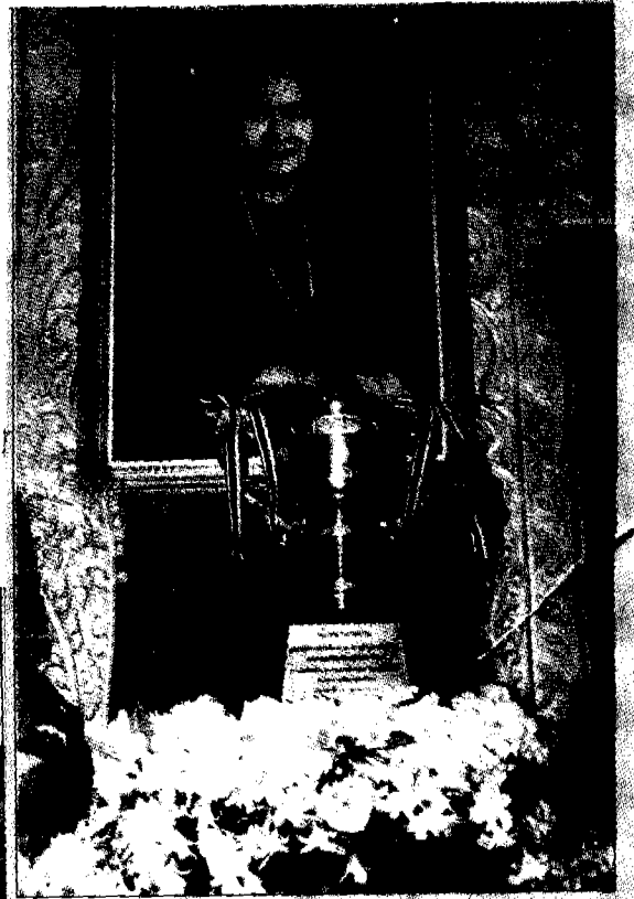
▲ ด้วยพระราชทานสมเด็จพระเจ้าพี่นางเธอ เจ้าฟ้ากัลยาณิวัฒนา กรมหลวงนราธิวาสราชนครินทร์ สำหรับผู้ชนะเลิศฝ่ายชาย