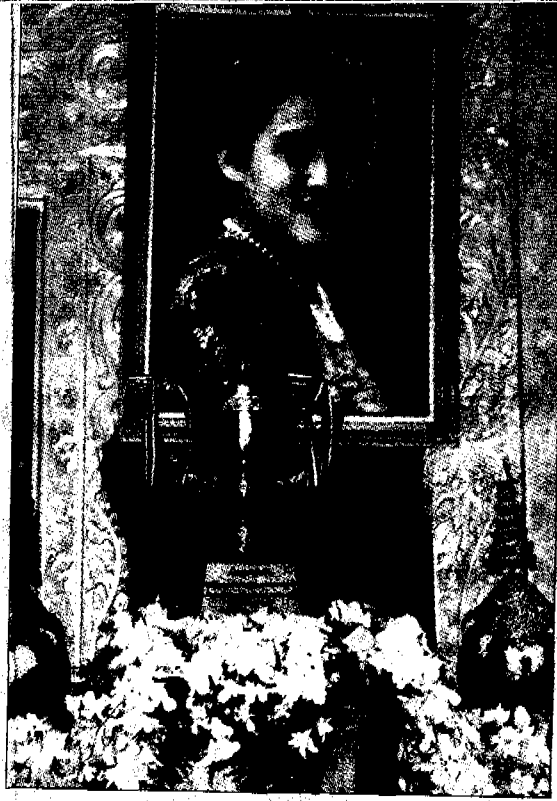
▲ ถ้วยพระราชทานสมเด็จพระเทพรัตนราชสุดาฯ สยามบรมราชกุมารี สำหรับผู้ชนะเลิศฝ่ายหญิง

สมเด็จพระเจ้าพี่นางเธอ เจ้าฟ้ากัลยาณิวัฒนา กรมหลวงนราธิวาสราชนครินทร์ เสด็จพระราชดำเนินในการพระราชทานถ้วยรางวัลการประกวดร้องเพลง "ขอเป็นคนดี" ในโครงการเกิดพระเกียรติสมเด็จพระย่าของปวงชนชาวไทย พร้อมทอดพระเนตรการดำเนินงาน การเรียนการสอนของศูนย์เด็กพิเศษ-นาวิน ๓ พระยานุเคราะห์มูลนิธิ ในพระอุปถัมภ์ของสมเด็จพระศรีนครินทราบรมราชชนนี ถนนพหลโยธิน 47 เมื่อเร็วๆ นี้