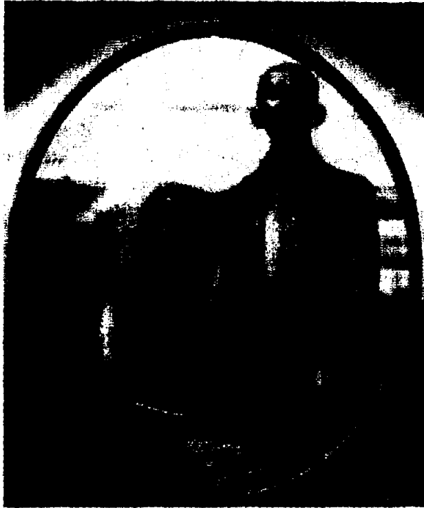
ดำหังพระองค์เดียว

พ.ศ. 2477 พระบาทสมเด็จพระปกเกล้าเจ้าอยู่หัว ทรง สละพระราชสมบัติ รัฐสภาได้มีมติอัญเชิญพระวรวงศ์เธอพระองค์ เจ้าอานันทมหิดล เสด็จขึ้นสืบราชสมบัติ พระองค์จึงทรงได้รับการ ถวายพระนามเป็น "สมเด็จพระราชชนนีศรีสังวาลย์" และเมื่อวันที่ 9 มิถุนายน 2519 พระบาทสมเด็จพระเจ้าอยู่หัวภูมิพลอดุลย เดชฯ ทรงพระกรุณาโปรดเกล้าฯ ให้เฉลิมพระอิสริยยศเป็น