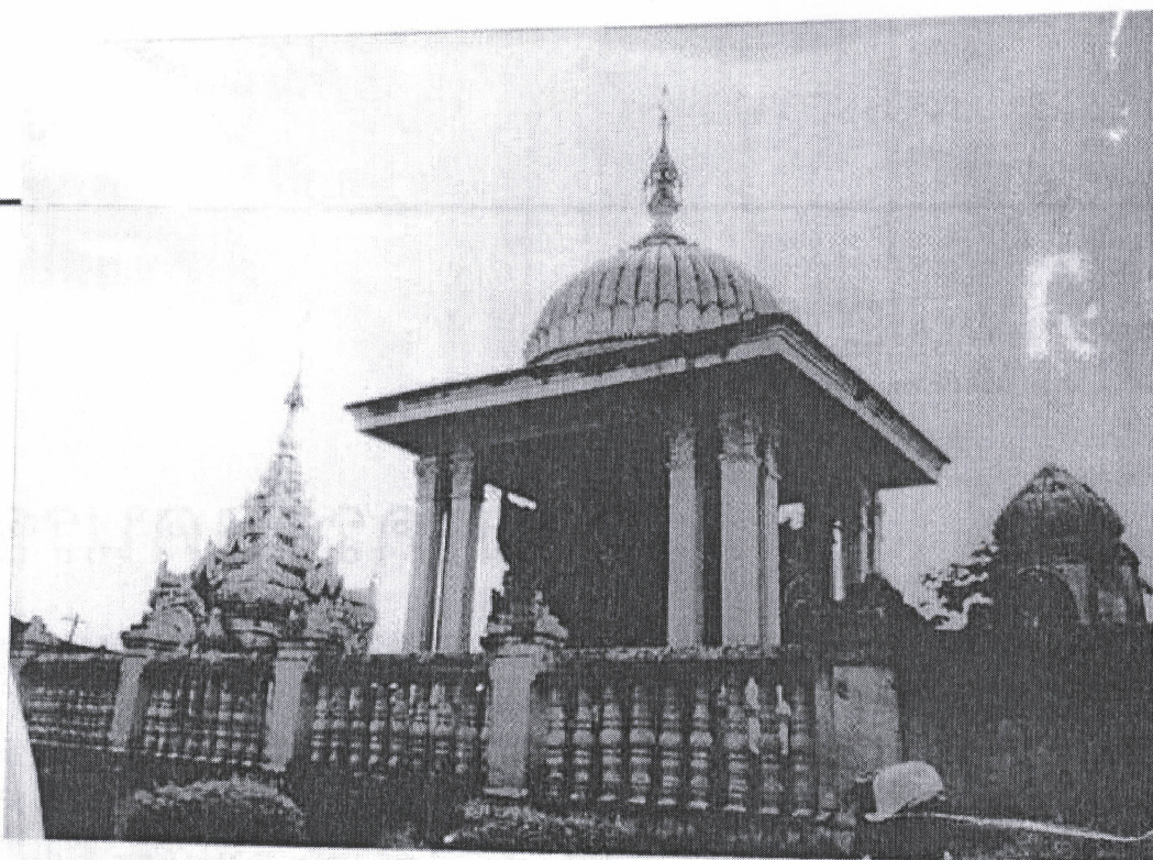
« กูเจ้าฟ้าเชียงตุง