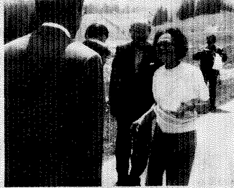
มาเรียมราชองค์ราชกุมารีแห่งประเทศ ณ เมืองจันทบุรี ซึ่งขณะนั้นดำรงตำแหน่งเจ้าฟ้าหญิงแห่งจอร์เจียแห่งจอร์เจีย