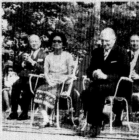
สมเด็จพระวันทวชิรญาณมหาราชเจ้าแห่งราชวรมหาเถรสมาคม ทรงปลื้มทรงการรงามประเทศ ณ นครเวียงจันทน์ ใหม่

ประมุขสงฆ์แห่งประเทศไทย และ ม.ล.ปนัดดา ดิศกุล เสด็จทรงชม ณ กรุงเทพมหานคร เมื่อ พ.ศ. 2517