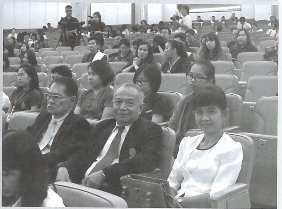
20 ปี มหาวิทยาลัยแม่ฟ้าหลวง พิธีทางศาสนาและอธิการบดีรายงานประชาชน ณ หอประชุมสมเด็จพระย่า ในมหาวิทยาลัย เมื่อวันที่ 24 กันยายน 2561