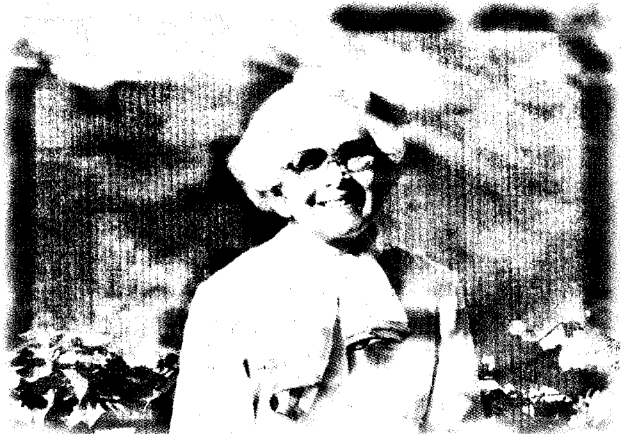
สมเด็จพระศรีนครินทราบรมราชชนนี

๖๖ มีว่า สมเด็จพระศรีนครินทราบรมราชชนนี จะเสด็จสู่สวรรคาลัยแต่ด้วยพระมหากรุณาธิคุณที่พระองค์ทรงมีต่อพสกนิกรชาวไทย ทำให้พระองค์ยังคงสถิตอยู่ในดวงใจของคนไทยทุกคน