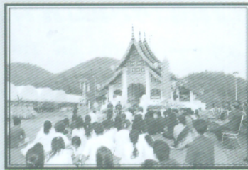
การเสนาในบรรยากาศล้านนา