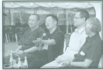
การเสนาเรื่อง “ความรุ่งเรืองทาง พุทธศิลป์ในล้านนา มองผ่านกระบวนการ ทัศน์ร่วมสมัย”