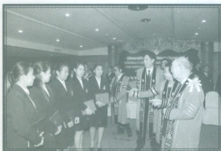
พล.ต.อ.เภา สารสิน กล่าวทักทาย