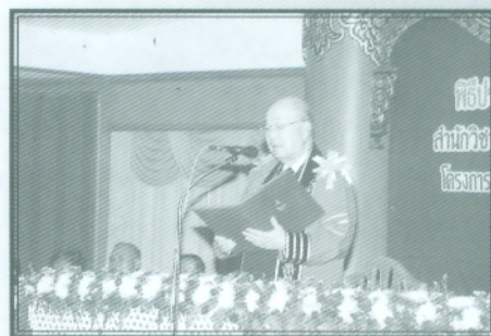
พล.ต.อ.เภา สารสิน กล่าวให้โอวาท