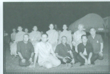
คณะสงฆ์ถ่ายภาพร่วมกับผู้เสนา