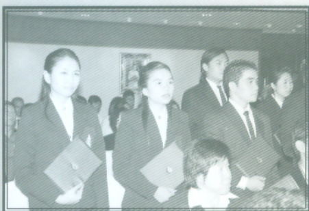
ผู้สำเร็จการศึกษากล่าวปฏิญาณตน