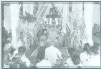
พระมหาวุฒิชัย บรรยายธรรม ให้แก่ญาติโยม