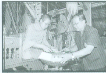
อธิการบดี ถวายหนังสือ