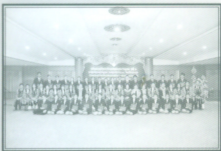
ผู้สำเร็จการศึกษาถ่ายรูปหมู่ร่วมกับผู้บริหารและคณาจารย์ อีกครั้งหนึ่ง