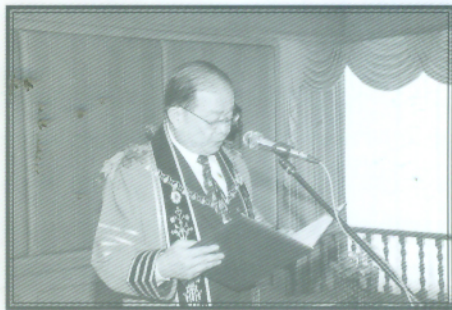
อธิการบดีกล่าวรายงานต่อประธานในพิธี