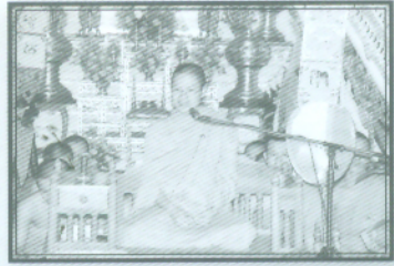
พระมหาวุฒิชัย