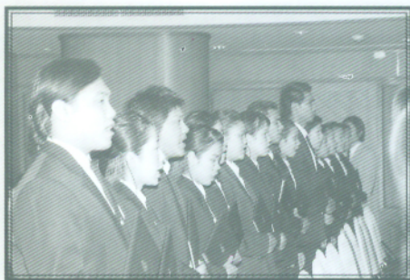
ภาพประทับใจของผู้สำเร็จการศึกษา