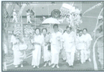
ศรัทธาวัดจากตำบลต่างๆ มาร่วมงานสมโภช