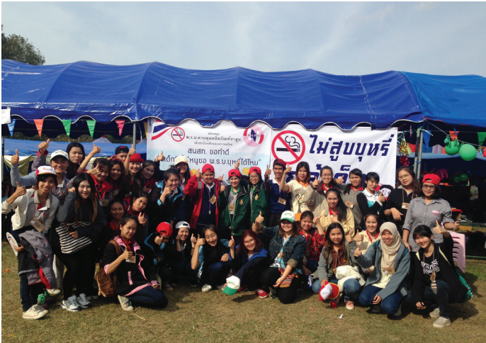
นักศึกษาทุน ร่วมจัดกิจกรรมวันเด็ก มอบความสุขให้น้องชาวเขา

นอกจากจัดการเรียนการสอนตามหลักสูตรให้กับนักศึกษาแล้ว มหาวิทยาลัยแม่ฟ้าหลวง ยังจัดกิจกรรมด้านต่างๆ ทั้งภายในและภายนอกมหาวิทยาลัย เพื่อเป็นส่วนเติมเต็มที่สำคัญที่จะช่วยเพิ่มพูนทักษะและประสบการณ์ให้กับนักศึกษา ซึ่งเปรียบเสมือนการเปิดประตูไปสู่โลกใบใหญ่ ที่เหล่านักศึกษาจะได้นำวิชาความรู้ที่ได้จากห้องเรียนออกไปสู่สังคม โดยเฉพาะการบำเพ็ญสาธารณประโยชน์ ที่เรียกว่า “จิตอาสา” ซึ่งถือเป็นการปลูกฝังคุณธรรมจริยธรรม ให้กับเหล่าคนรุ่นใหม่ เมื่อสำเร็จการศึกษาออกไปทำงานในภาคส่วนต่างๆ จะได้ช่วยสร้างสรรค์ให้เกิดสังคมคุณภาพต่อไป