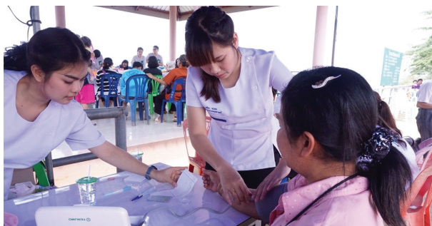
ชมรมปณิธานหมอเจ้าฟ้า ลงพื้นที่ตรวจสุขภาพชุมชน พร้อมพัฒนาสิ่งแวดล้อมโรงเรียนห่างไถล

ชมรมรักษ์ประชาธิปไตย หรือ ชมรมครูดอย ฝากความเหน็บหนาวของสภาพอากาศ ขนความซุซมากมายไปจัดค่ายอาสาให้กับเด็ก ๆ โรงเรียนเพียงหลวง 16 บ้านขุนต้า อ.เทิง จ.เชียงราย ใน “โครงการปันน้ำใจประชาธิปไตยสู่ชุมชน ครั้งที่ 26” ระหว่างวันที่ 18-22 มกราคม 2559 โดยมีเป้าหมายเพื่อส่งเสริมการเรียนรู้ในเชิงสร้างสรรค์ให้เด็กผู้ด้อยโอกาส ผ่านการจัดกิจกรรมทั้งทางด้านวิชาการและสันตนาการ เช่น การสอนหนังสือ กีฬา การปรับปรุงภูมิทัศน์และอาคารเรียน และงานวันเด็กย้อนหลัง สร้างความดีใจให้กับน้องๆ เป็นอย่างมาก และต่างเรียกร้องให้พี่ๆ ครูดอยกลับไปจัดค่ายที่โรงเรียนอีกในปีต่อไป