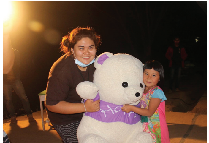
ชมรมครูดอย มฟล. ฝากความหนาว จัดค่ายเติมไออุ่นเด็กดอยโอกาส

นักศึกษาทุนกู้ยืมเพื่อการศึกษา และนักศึกษาทุนทุกประเภทของ มฟล. ร่วมกับ กองร้อยตำรวจตระเวนชายแดนที่ 327 อ.แม่จัน จ.เชียงราย จัดกิจกรรม “วันเด็กแห่งชาติ ประจำปี 2559” เมื่อวันเสาร์ที่ 9 มกราคม 2559 ซึ่งเป็นกิจกรรมที่จัดขึ้นให้กับเด็กๆ ในพื้นที่ใกล้เคียงเป็นประจำทุกปี โดยเฉพาะเด็กชาวเขาที่มีโอกาสได้รับความสุขแบบนี้เพียงปีละครั้งเท่านั้น อีกทั้งยังเป็นการเปิดโอกาสให้นักศึกษาทุนได้บำเพ็ญประโยชน์ตอบแทนสังคม ภายใต้งานมีการละเล่นและของขวัญรางวัลมากมาย สร้างรอยยิ้มและความสุขให้กับผู้เข้าร่วมกิจกรรมทุกคนเป็นอย่างมาก