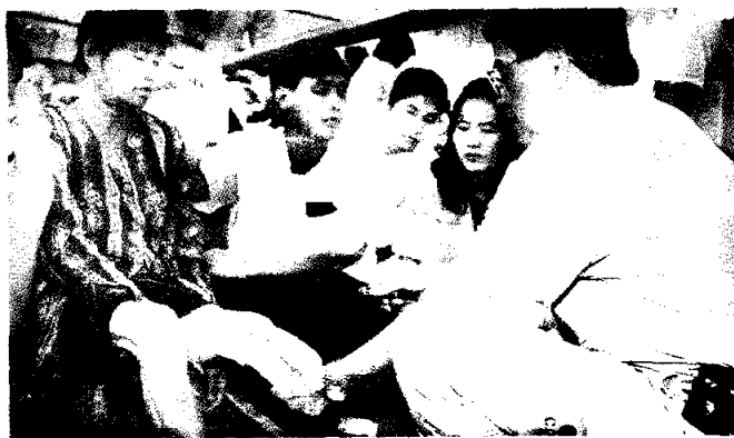
▲ กิจกรรมระหว่างออกหน่วยเคลื่อนที่ขาเทียมพระราชทาน

พิการชาชาติและผลิตไม้เท้าสำหรับผู้สูงอายุทั่วประเทศ โดยเปิดรับบริจาคตั้งแต่บัดนี้จนถึงเดือนมีนาคม จากนั้นทางโครงการจะรวบรวมเงินและอะลูมิเนียมที่ได้ทั้งหมดไปหลอม และถวายแด่สมเด็จพระเจ้าพี่นางเธอ เจ้าฟ้ากัลยาณิวัฒนาฯ เพื่อมอบให้แก่มูลนิธิชาเทียมต่อไป เชิญร่วมสร้างกุศลเพื่อผู้พิการชาชาติทั่วประเทศได้ตั้งแต่วันนี้