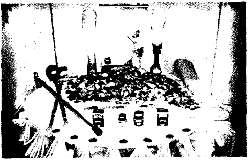
▲ ผ้าแบรนด์ที่นำไปใช้ประโยชน์เพื่อผู้พิการ

พร้อมกันนี้ ก็ขอเชิญชวนผู้ที่อยากมีส่วนร่วมในกิจกรรมดีๆ บริจาคเงินหรือนำผ้าแบรนด์หรือวัสดุอะลูมิเนียมเหลือใช้อื่นๆ นำมามอบให้แก่โครงการ เพื่อนำไปผลิตขาเทียมแจกจ่ายให้แก่ผู้