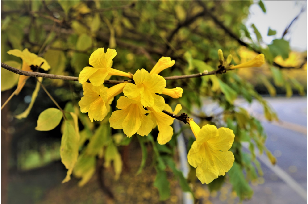
เหลืองเชียงราย

ปีที่ 7 ฉบับที่ 1 เดือน มีนาคม พ.ศ. 2565